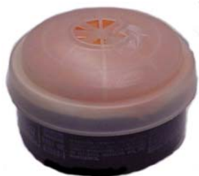
Combinación apropiada de cartucho y filtro