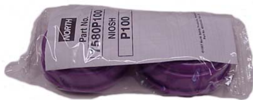
Paquetes de fábrica sellados

Utilice solamente cartuchos y filtros nuevos para reemplazar los viejos. Todos los cartuchos y filtros nuevos vienen en paquetes de fábrica sellados. No cambie los cartuchos y filtros usados con otros que estén en paquetes abiertos.